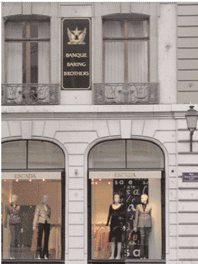
L'établissement s'appelle aujourd'hui Baring Brothers Sturdza . C'est la commission fédérale des banques qui l'a demandé.

Seule ombre sur ce bijou: une absence notoire de synergies avec son propriétaire. Du côté des produits, de